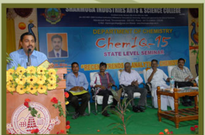
Department of Chemistry