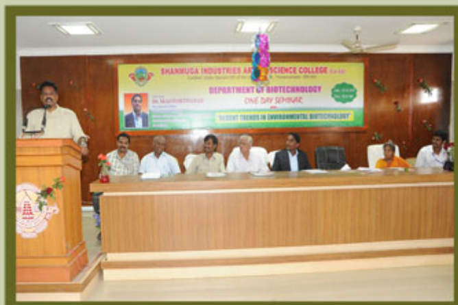
Department of Biotechnology