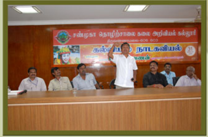
EDUCATIONAL FINE ARTS SEMINAR