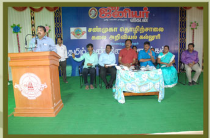
JUNIOR VIKATAN ORGANISED TAMIL MANNE VANAKAM