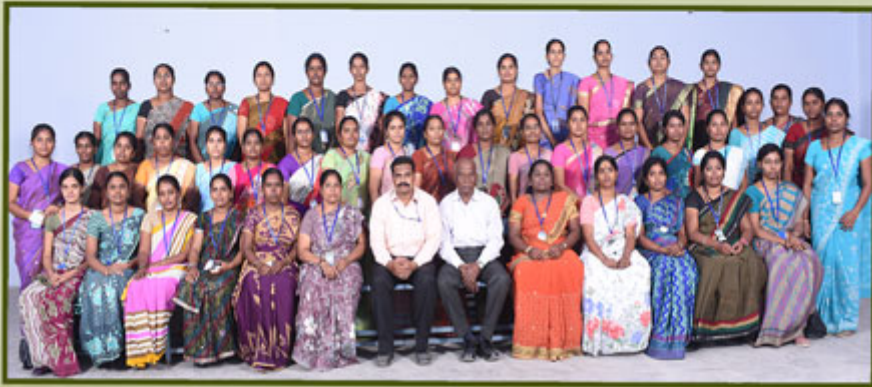
Science Department Women Staff