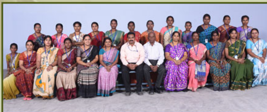
Arts Department Women Staff