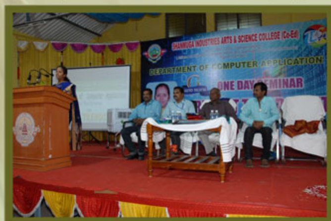
Department of BCA