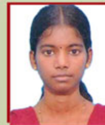
E.VIDYA VIII RANK MCA