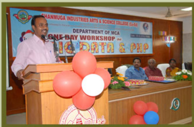
Department of MCA