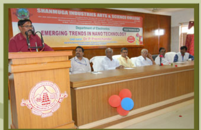
Department of Electronics