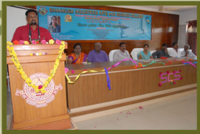
Department of SCS