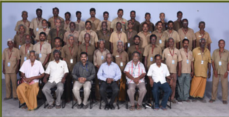
Bus Driving Staff