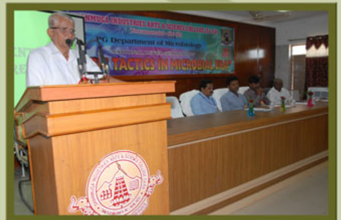
Department of Microbiology