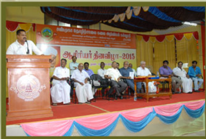
TEACHER'S DAY CELEBRATIONS