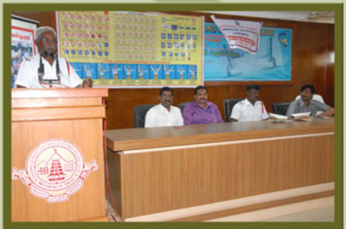
ROAD SAFETY AWARENESS PROGRAMME