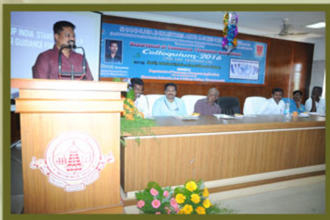
Department of Department of B.Com (CA)