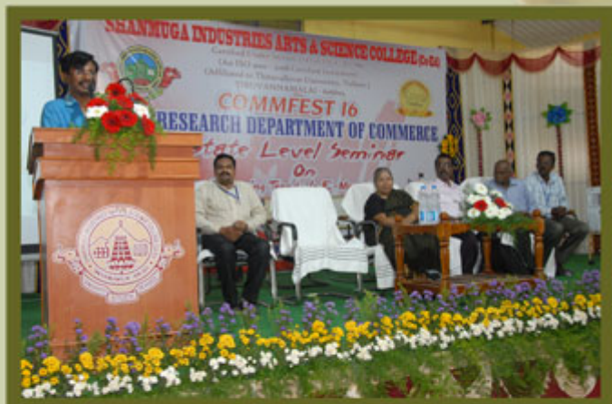
Department of B.COM