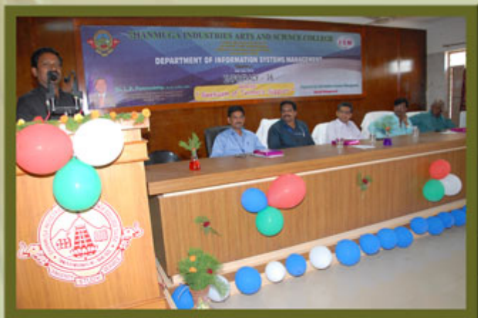
Department of ISM