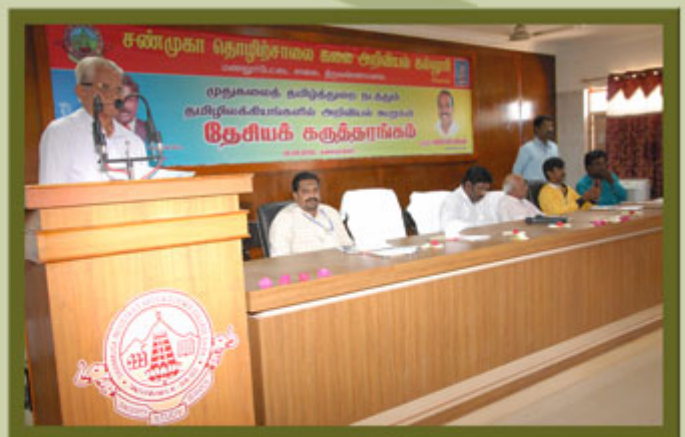
Department of Tamil