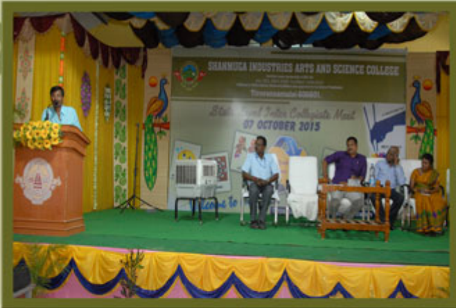
Department of BBA