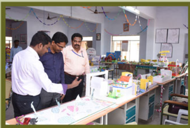
NATIONAL SCIENCE EXHIBITION