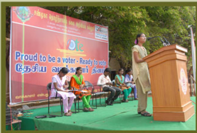
VOTERS DAY PROGRAMME