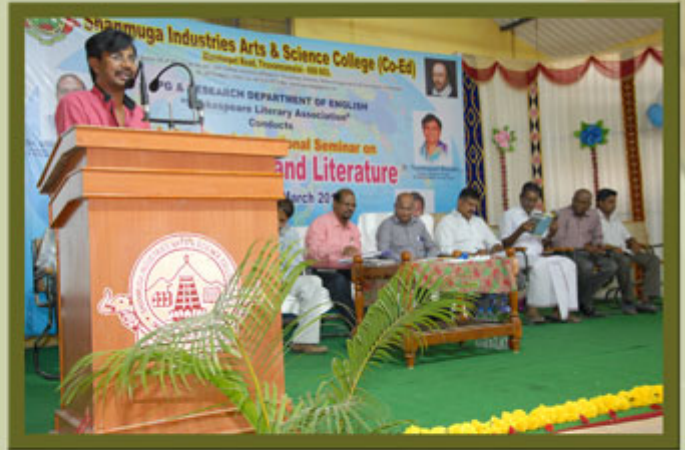
Department of English