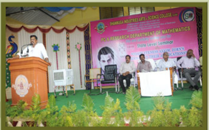
Department of Maths