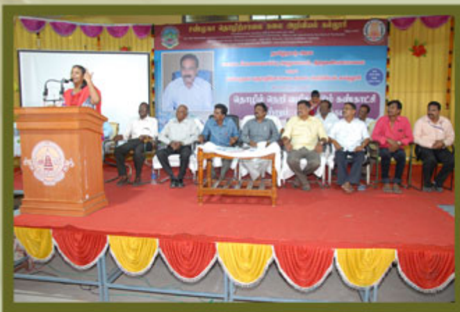
EMPLOYEMENT AWARENESS PROGRAMME