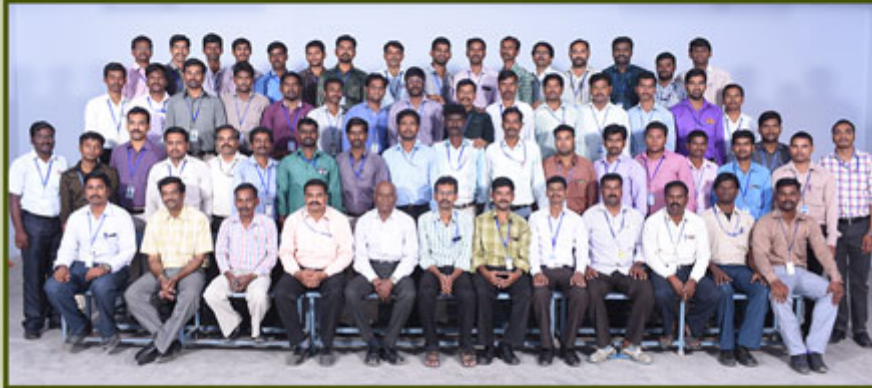
Science Department Men Staff