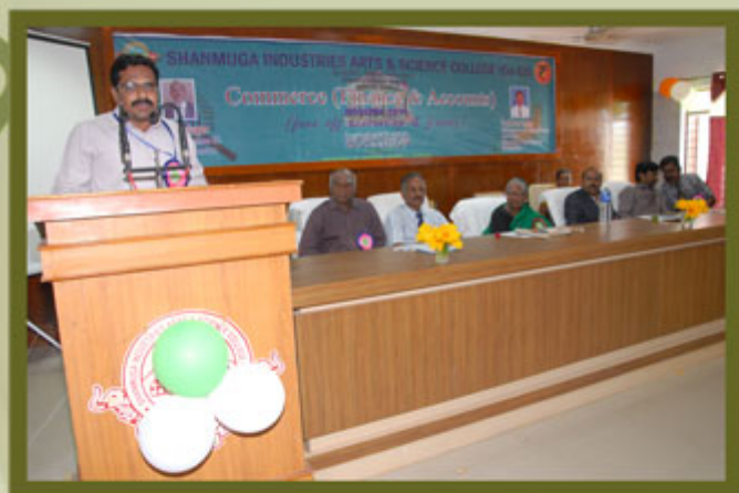
Department of B.Com (FA)