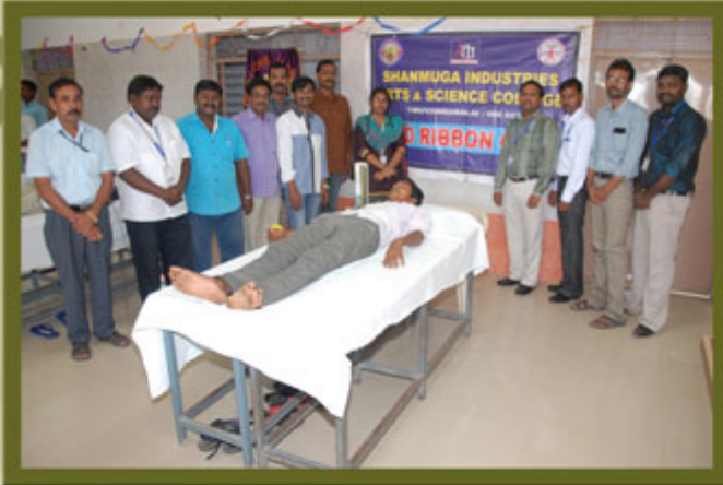
BLOOD DONATION CAMP