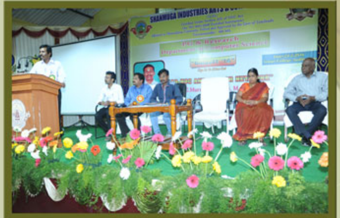
Department of Computer Science