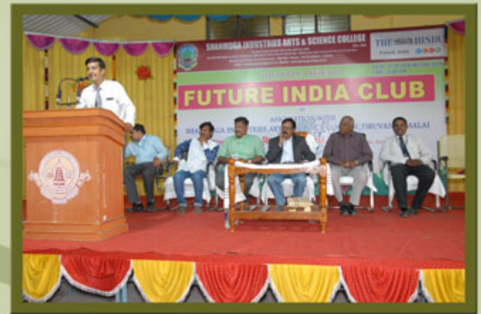
THE HINDU PRESENT FUTURE INDIA CLUB PROGRAMME