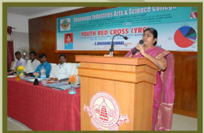
YOUTH RED CROSS PROGRAMME