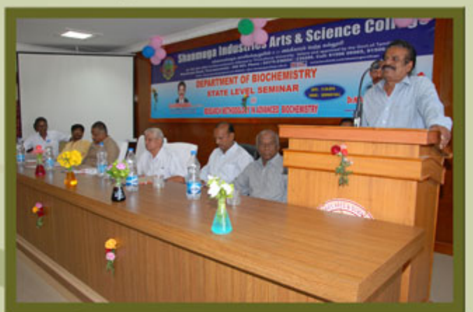
Department of Bio Chemistry