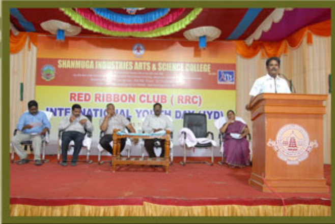
RED RIBBON CLUB PROGRAMME