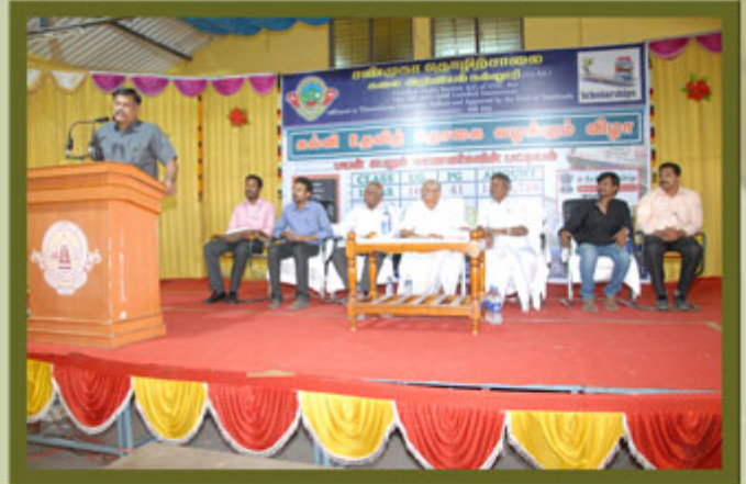
SCHOLARSHIP DISTRIBUTION PROGRAMME