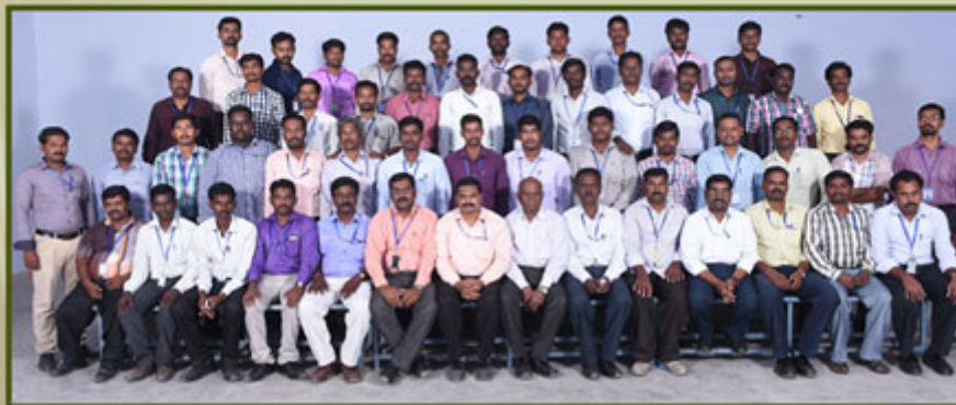
Arts Department Men Staff