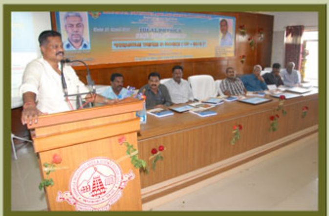
Department of Physics