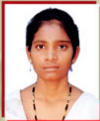
E.INTHUPRIYA VII RANK B.COM FA